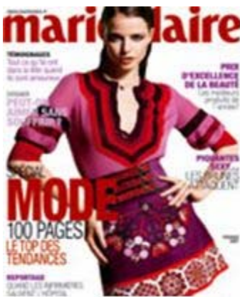
Marie Claire France Février 2007