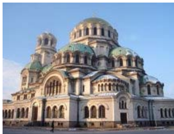
La cathédrale Alexandre Nevski