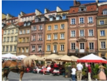
La ville médiévale