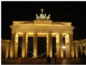
La Porte de Brandebourg