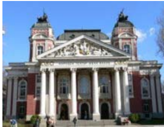
Le théâtre national Ivan Vazov