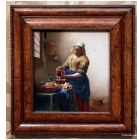
Le musée Rijksmuseum