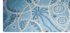
Les « azulejos »