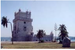
La tour de Belem