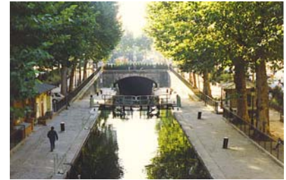
Le Canal Saint Martin