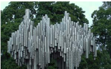
Le monument de Sibelius