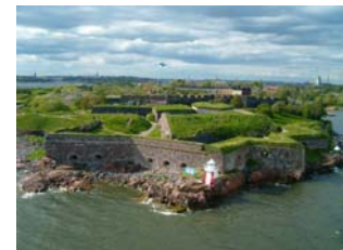
La forteresse de Suomenlinna