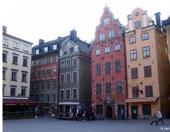
La place Stortorget