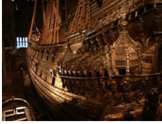
Le musée Vasa