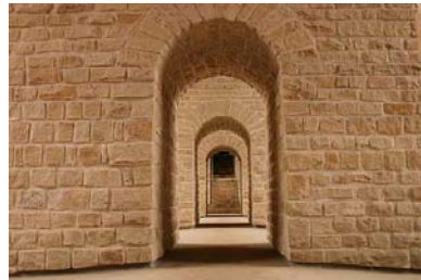
La citadelle Vauban