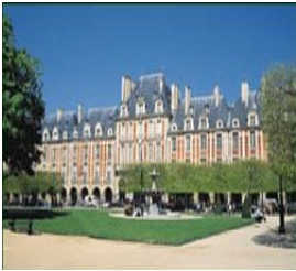
La Place des Vosges