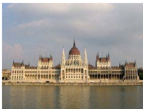
Le Parlement sur le Danube