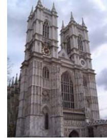
L'abbaye de Westminster