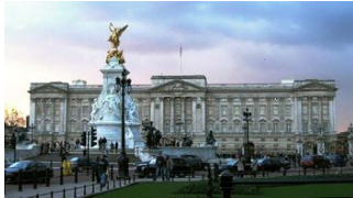
Le palais de Buckingham