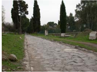
La voie Apienne