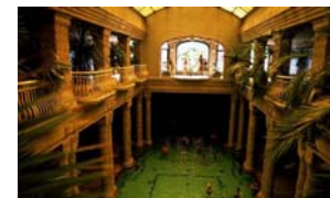
Les bains turcs