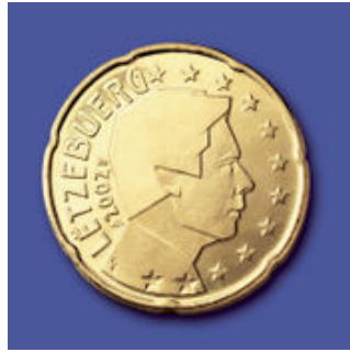
Le grand-duc Henri