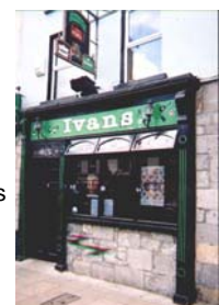
Les pubs traditionnels